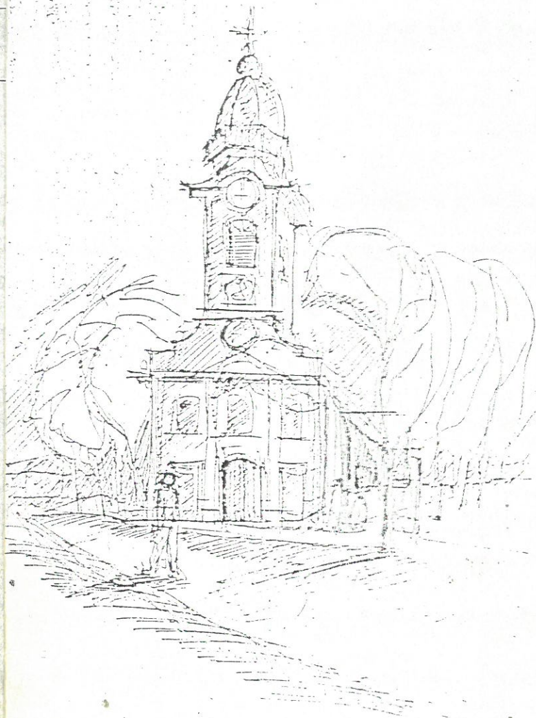
Klaus Thiele /NDK/